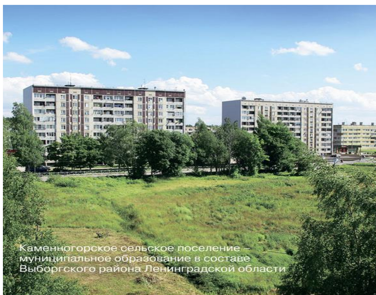
Каменногорское сельское поселение – муниципальное образование в составе Выборгского района Ленинградской области

36% всего населения района проживает в административном центре — городе Выборге.