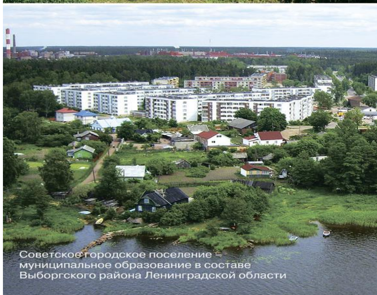
Советское городское поселение – муниципальное образование в составе Выборгского района Ленинградской области